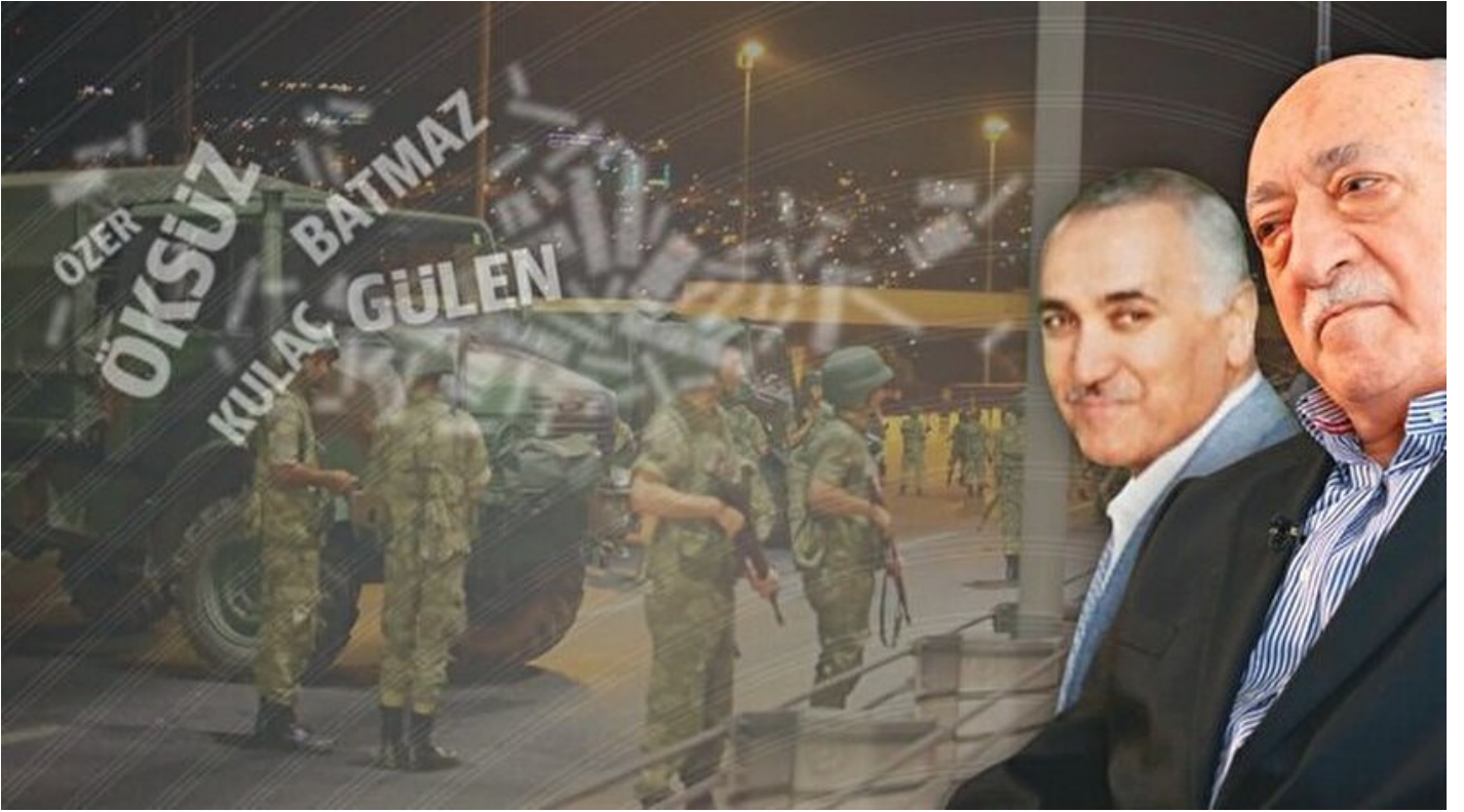
Adil Öksüz ve Fetullah Gülen.