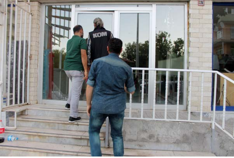
Kaman'daki 3 eğitim kurumunun, işlemlerin ardından kapatıldığı öğrenildi.