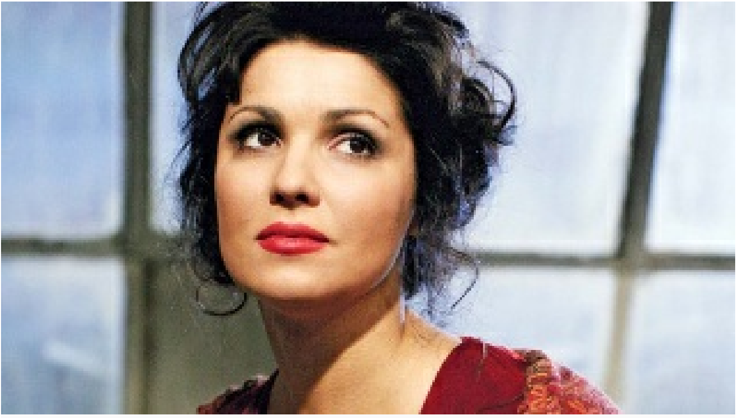
Rus diva Netrebko La Scala'ya çıkmadı