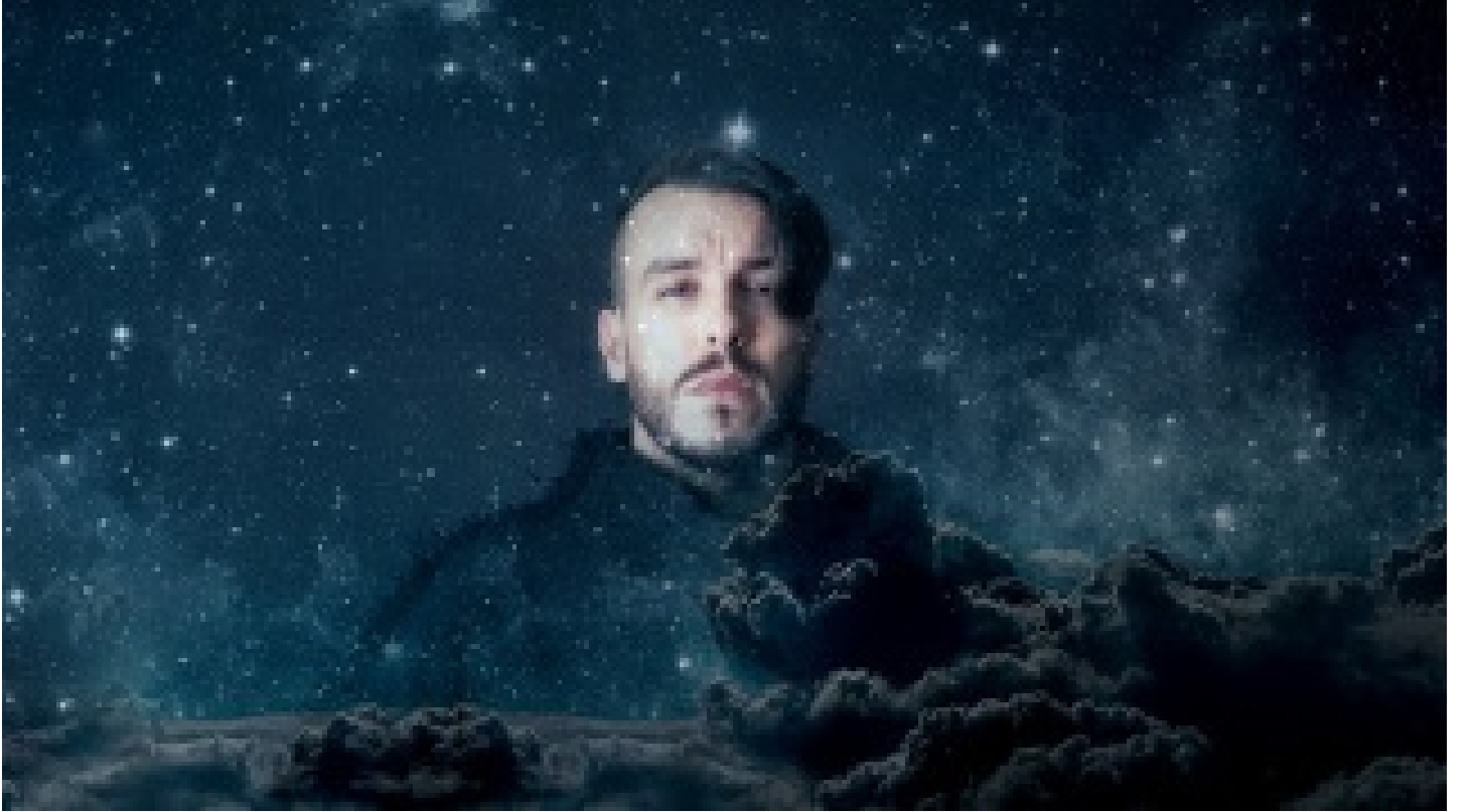
Bu albümü bize ithaf ediyorum: Gökyüzümün yıldızları