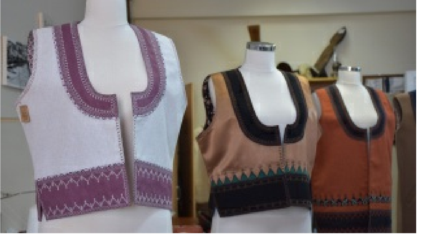
Asırlık kıyafetler 'Şimal Kadını' defilesinde