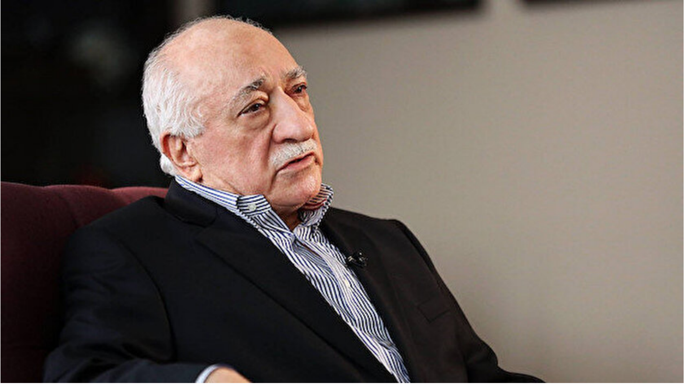
FETÖ elebaşı Fethullah Gülen