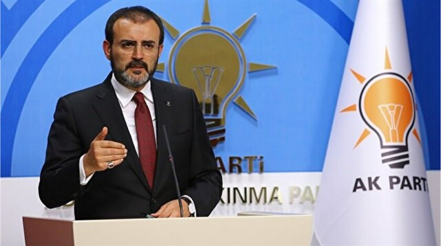
AK Parti Sözcüsü Mahir Ünal

Haber Merkezi · 06 Haziran 2017, 19:38 · Son Güncelleme: 06 Haziran 2017, 21:22 · Yeni Şafak