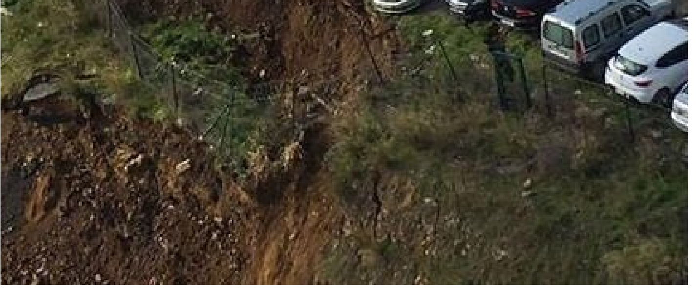
Ataşehir'de araçlar göçüğe düştü.