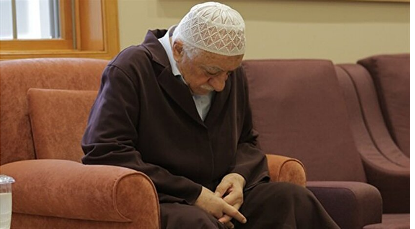
FETÖ elebaşı Fetullah Gülen

Haber Merkezi · 25 Ağustos 2016, 13:57 · Son Güncelleme: 25 Ağustos 2016, 14:50 · AA