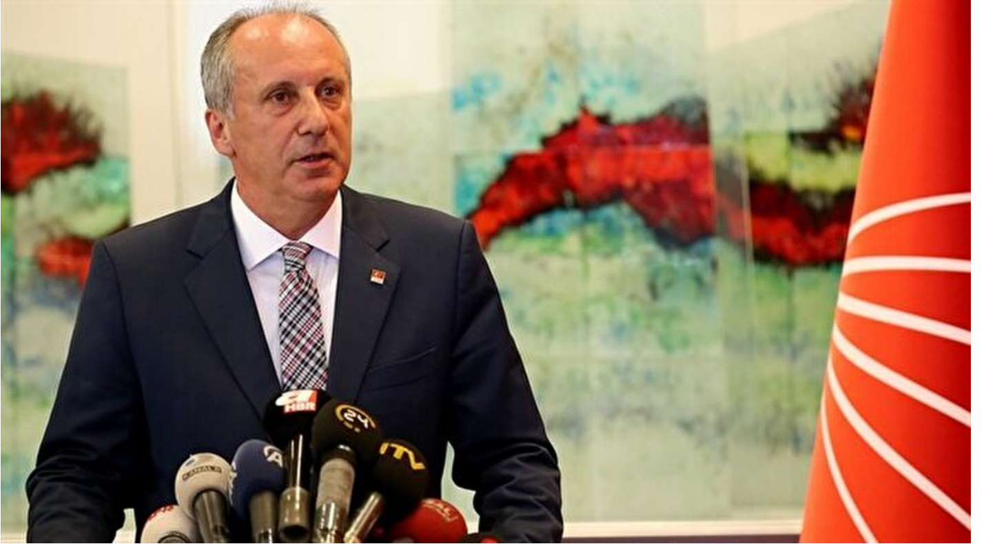
CHP'nin mağlup Cumhurbaşkanı adayı Muharrem İnce

Haber Merkezi · 01 Temmuz 2018, 04:00 · Son Güncelleme: 01 Temmuz 2018, 09:30 · Yeni Şafak