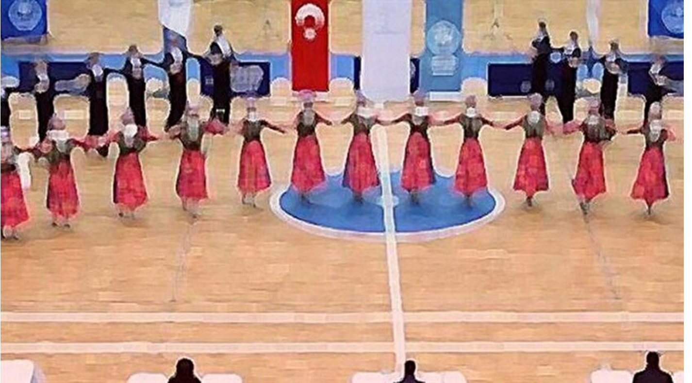
Folklor ekibi temsili

Haber Merkezi · 04 Ocak 2018, 10:09 · Son Güncelleme: 04 Ocak 2018, 10:11 · Diğer