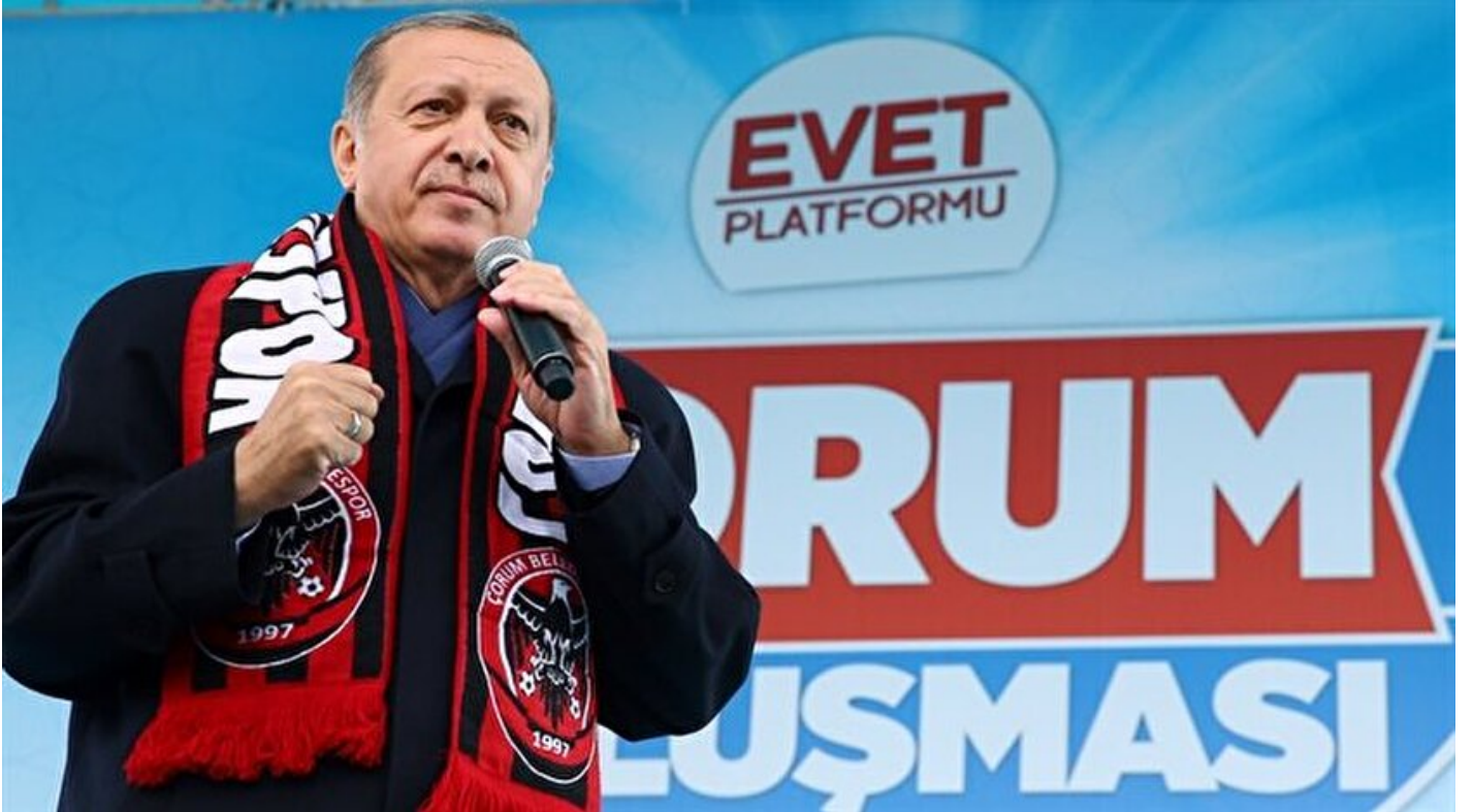
Cumhurbaşkanı Recep Tayyip Erdoğan.

Haber Merkezi · 10 Nisan 2017, 15:40 · Son Güncelleme: 10 Nisan 2017, 16:48 · AA