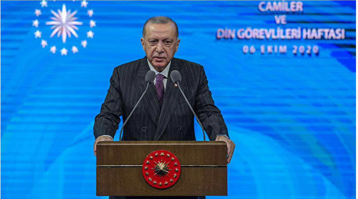
Cumhurbaşkanı Recep Tayyip Erdoğan.

Haber Merkezi · 06 Ekim 2020, 15:16 · Son Güncelleme: 06 Ekim 2020, 16:22 · Yeni Şafak