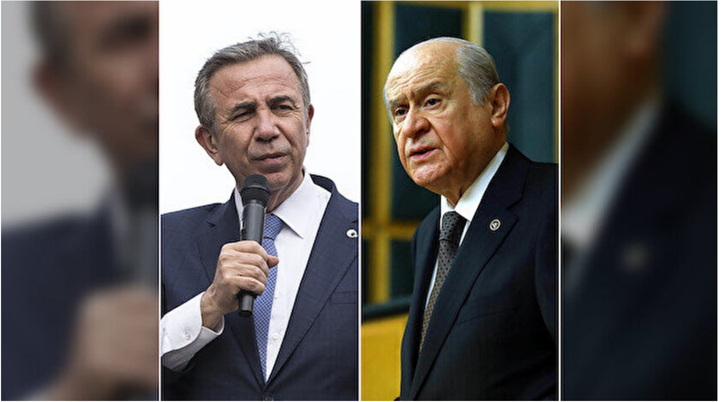
Mansur Yavaş ve Devlet Bahçeli.