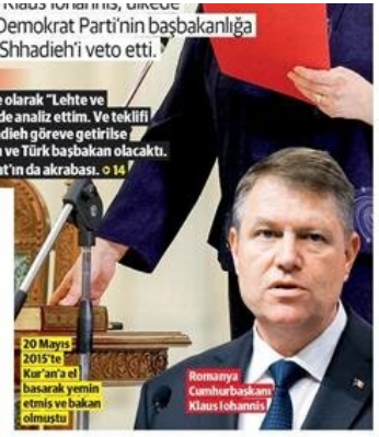
20 Mayıs 2015'te Berlin'de Kar'an'a el basarak yemin etmiş ve bakan olmuştu