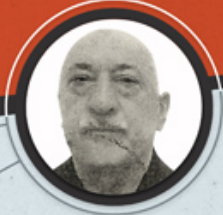
FETÖ elebaşı Fetullah Gülen

FETÖ/PDY'nin çeşitli soruşturmalarda kurduğu kumpaslara ve 15 Temmuz darbe girişimine ilişkin ülke genelinde açılan davalardan 7'si, hafta boyunca İstanbul, Ankara, Muğla ve Kırklareli'nde devam edecek