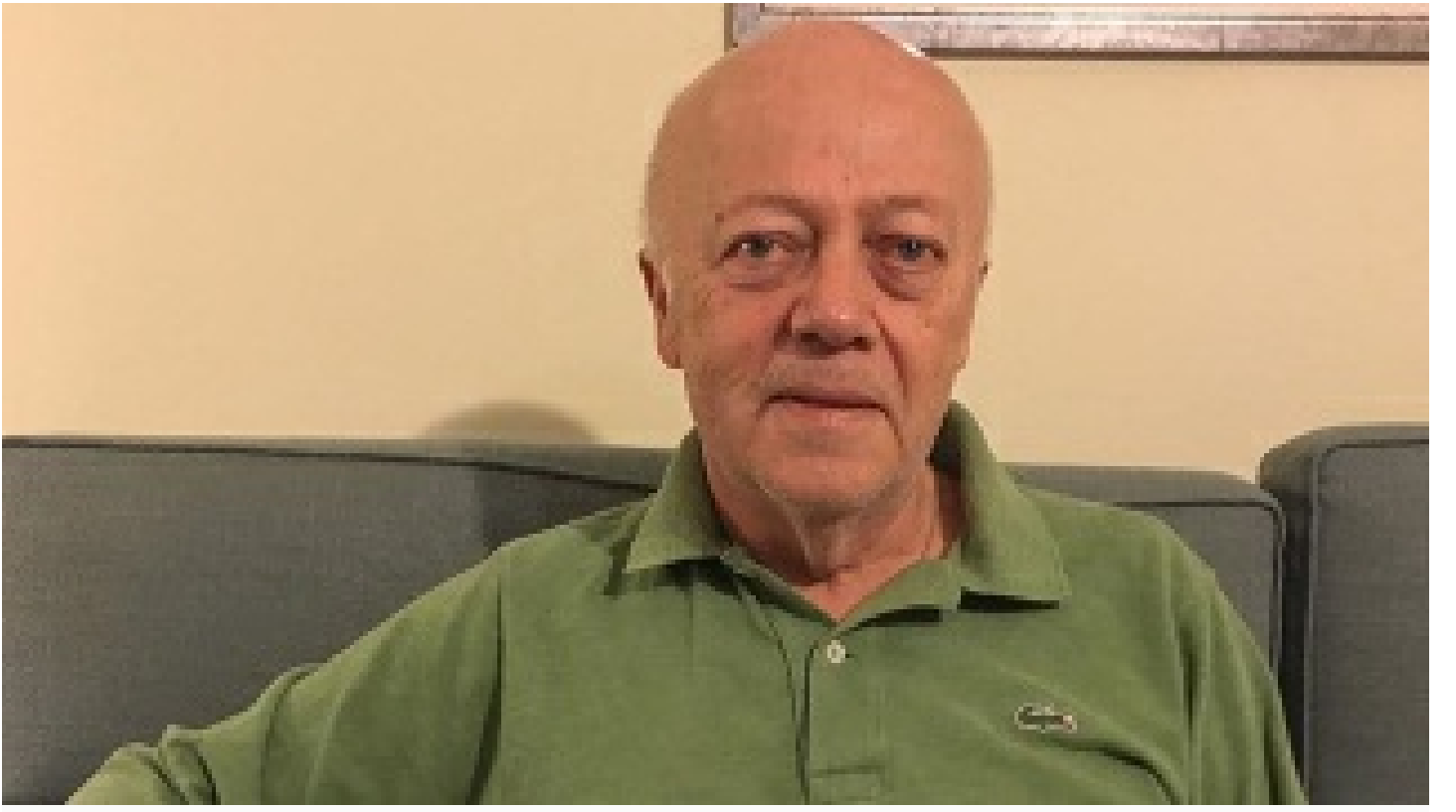
Can Baydarol ambargonun olası etkilerini anlattı: Türkiye'nin stratejik önemi daha da artacak