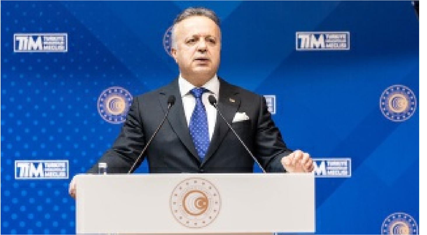
TİM Başkanı Gülle: Yerel paralarla ticaretin en doğrusu olduğu görüldü