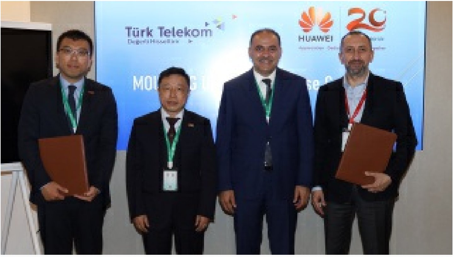
Türk Telekom'dan Çinli şirketlerle iki yeni işbirliği