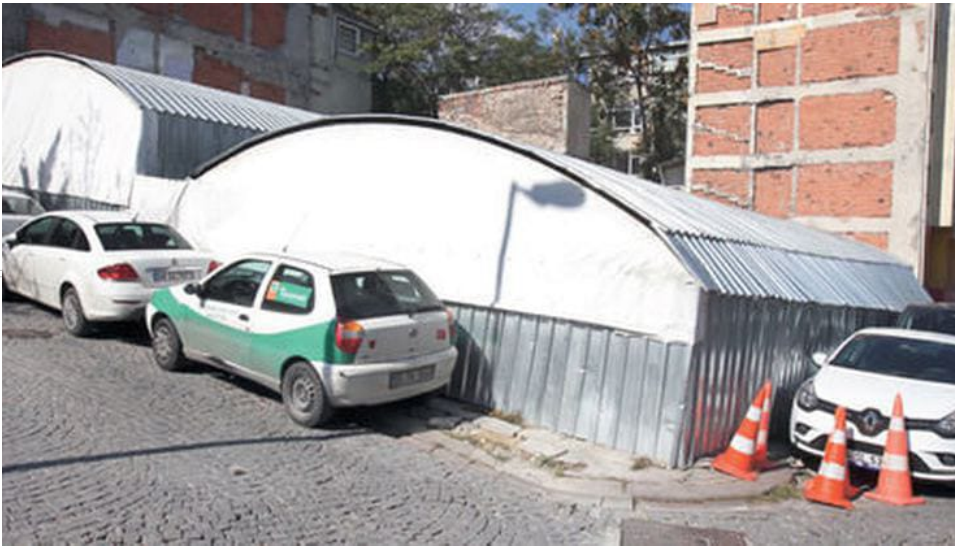
BİK yıkılan binanın enkazı

Basın İlan Kurumu, 25 Şubat 2011'de imzalanan ve 1 Mart 2011'de başlayan sözleşme uyarınca, Toya Plaza'ya taşındı. Odatv'nin kurum kulislerinden öğrendiği bilgiye göre, o dönemde aylık kirası 30 bin Euro olarak belirlenen kurum, bir süre önce kirasına zam yaparak 31 bin Euro'ya yükseltti. Sultanahmet'teki binasını yaptırmayan Basın İlan Kurumu, 2011'den bu yana, devlet kasasından 89 ayda yaklaşık 2 milyon 670 bin Euro kira ödedi.