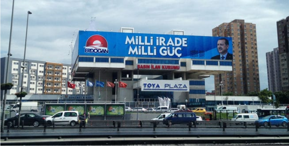
BİK'in şu anda kirada olduğu bina

Basın İlan Kurumu, 25 Şubat 2011'de imzalanan ve 1 Mart 2011'de başlayan sözleşme uyarınca, Toya Plaza'ya taşındı. Odatv'nin kurum kulislerinden öğrendiği bilgiye göre, o dönemde aylık kirası 30 bin Euro olarak belirlenen kurum, bir süre önce kirasına zam yaparak 31 bin Euro'ya yükseltti. Sultanahmet'teki binasını yaptırmayan Basın İlan Kurumu, 2011'den bu yana, devlet kasasından 89 ayda yaklaşık 2 milyon 670 bin Euro kira ödedi.