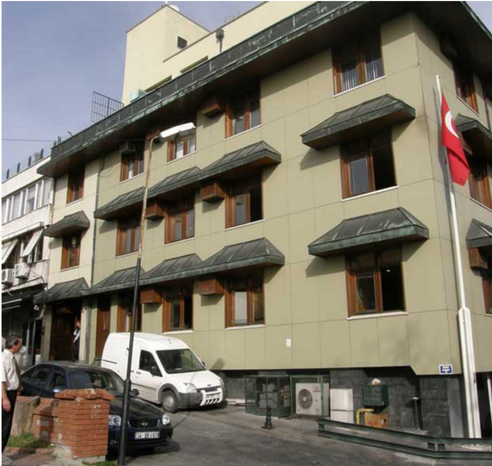
BİK yıkılan bina

Basın İlan Kurumu'nun dövizle kira ödeme dönemi 2011 yılında başladı. Odatv'nin kulislerden edindiği bilgilere göre, 40 milyon dolar değerindeki İstanbul Sultanahmet'teki genel müdürlük binasını 2011 yılında boşaltan Basın İlan Kurumu, binanın tadilatının yapılmasının ardından geri döneceğini açıklamıştı. Ancak tarihi bina yıkıldı! Yıkılan bina, Binbirdirek Sarnıcı'na zarar verdiği gerekçesiyle enkaz halinde bekletiliyor. Binanın sırf kira ödemek için bilerek yıkılıp yıkılmadığı iddiaları ise ortada duruyor.