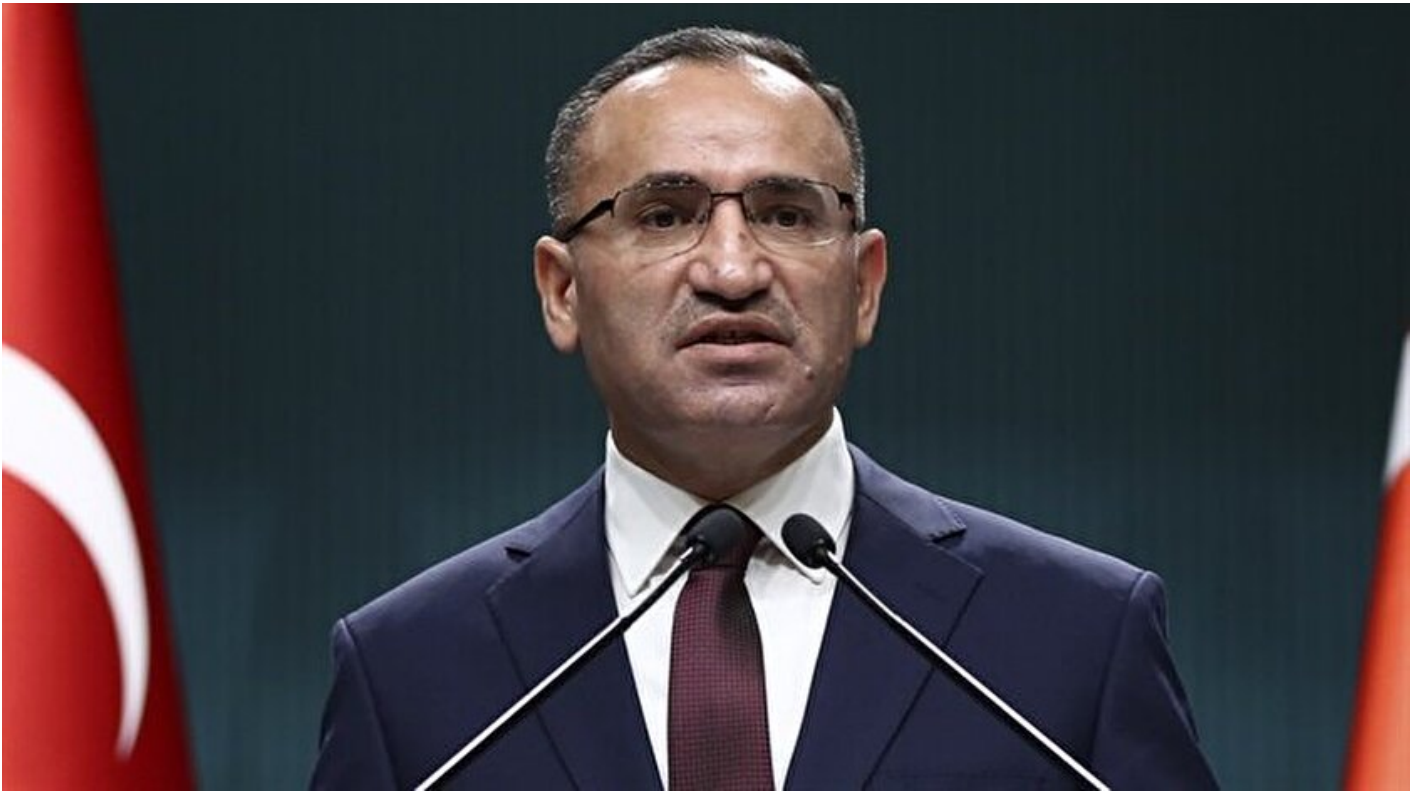
Hükümet Sözcüsü Bekir Bozdağ