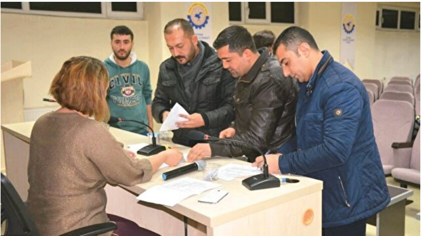
Oda seçimlerinde 2 yıl şartı