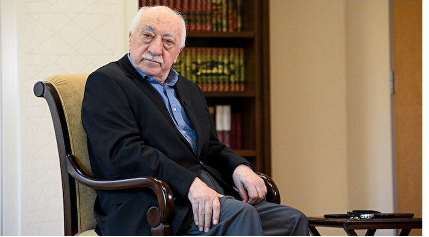
FETÖ kurucusu ve lideri Fetullah Gülen

Haber Merkezi · 17 Aralık 2019, 18:33 · Son Güncelleme: 17 Aralık 2019, 19:41 · AA