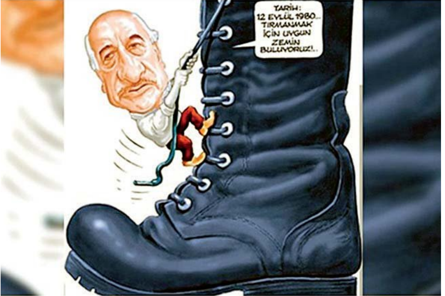
Musa Kart 2000'li yıllardan beri FETÖ tehlikesini çiziyordu.

üyesi olmamak ve örgüt adına suç işlememekle birlikte, hareketleriyle örgütün çıkarlarına hizmet etmekle suçlanıyorum. Tanıtım, çok net ve kısa olacak: Bu suçlamayı aynen iade ediyorum. Bir karikatüristi terör örgütlerine yardım ve yataklık yapmakla suçlamak sadece karikatüriste değil bu ülkeye kötülüktür. Karikatürle şiddete dayalı örgütlerin yan yana gelmesi eşyanın tabiatına aykırıdır. Tatil için aradığım numara yüzünden Silivri'de dokuz ay kaldım. Yanlış rezervasyon! 35 yıllık karikatüristim akıl almaz iddialarla suçlanıyorum. Suçlamayı aynen iade ediyorum.”