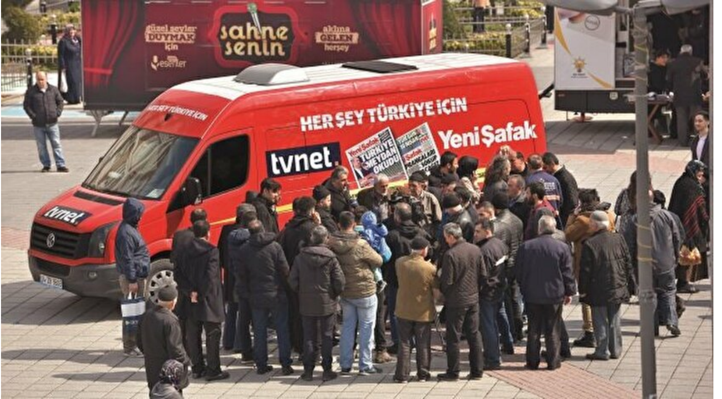
Trabzon Evet rekoru kıracak