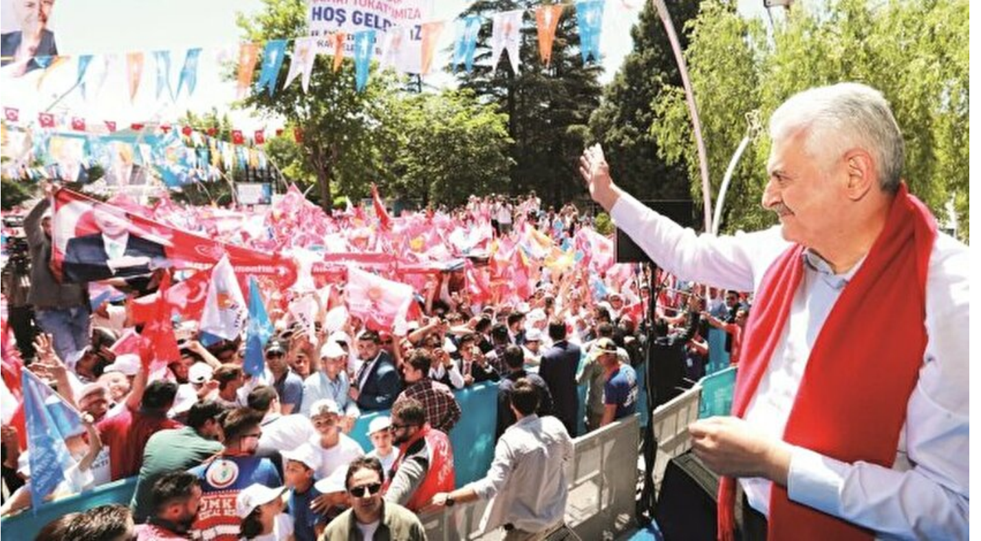
Başbakan Binali Yıldırım, Tokat ve Sivas mitinglerinde konuştu

Haber Merkezi · 17 Haziran 2018, 04:00 · Yeni Şafak