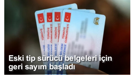
Eski tip sürücü belgeleri için geri sayım başladı