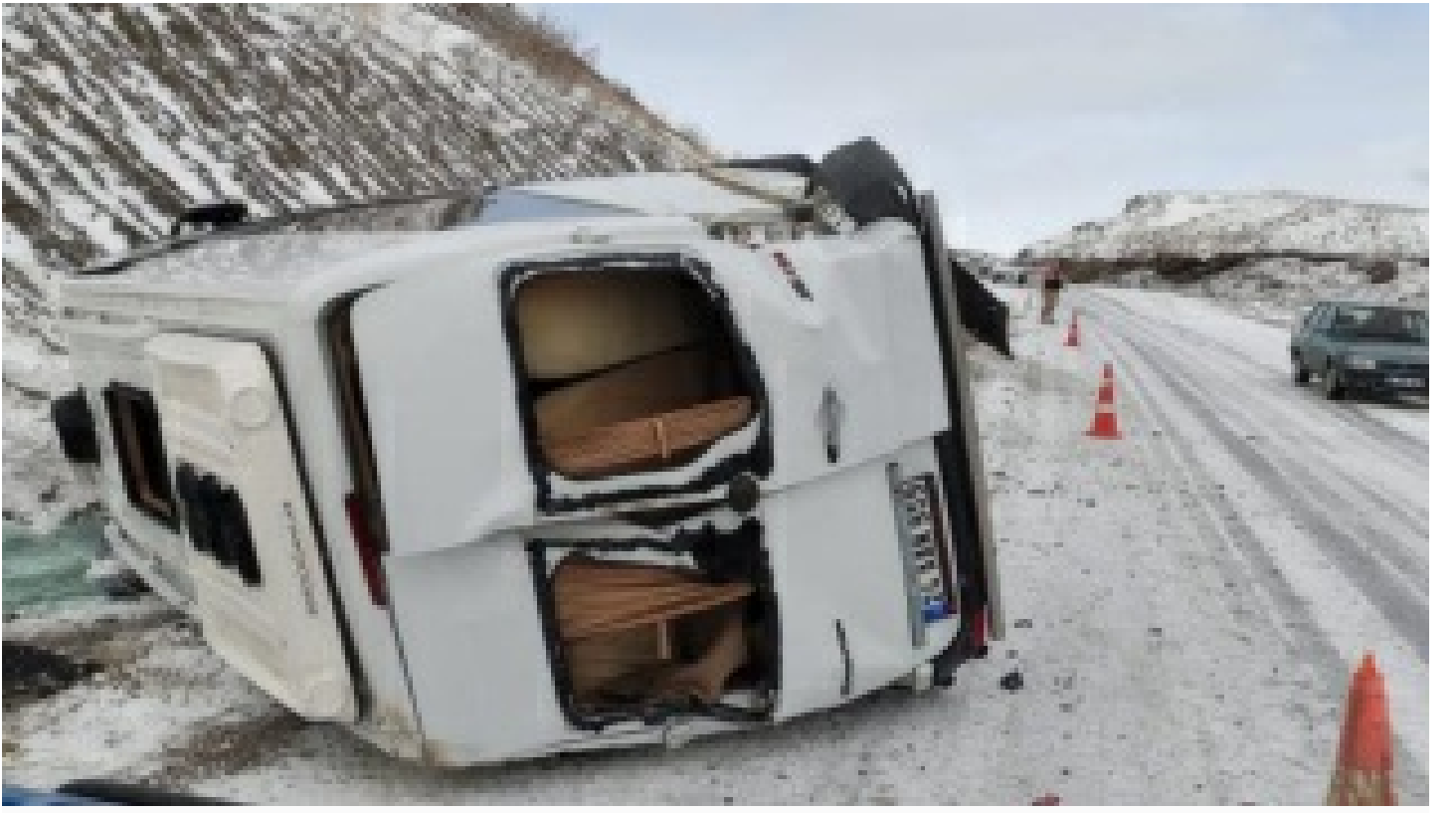
Erzincan'da devrilen minibüsteki 8 kiři yaralandı