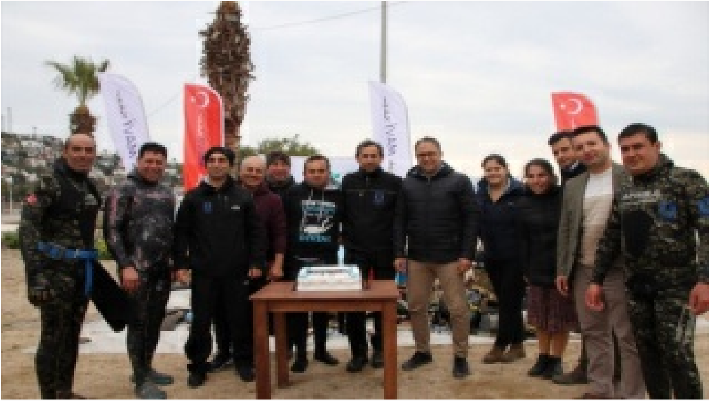
Dalgıçlar denizi, öğrenciler kıyıyı temizledi