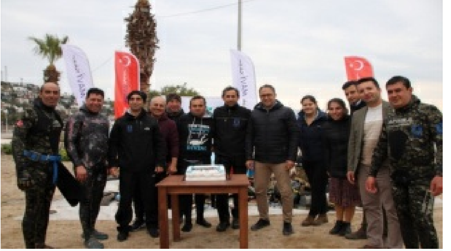
Dalgıçlar denizi, öğrenciler kıyıyı temizledi