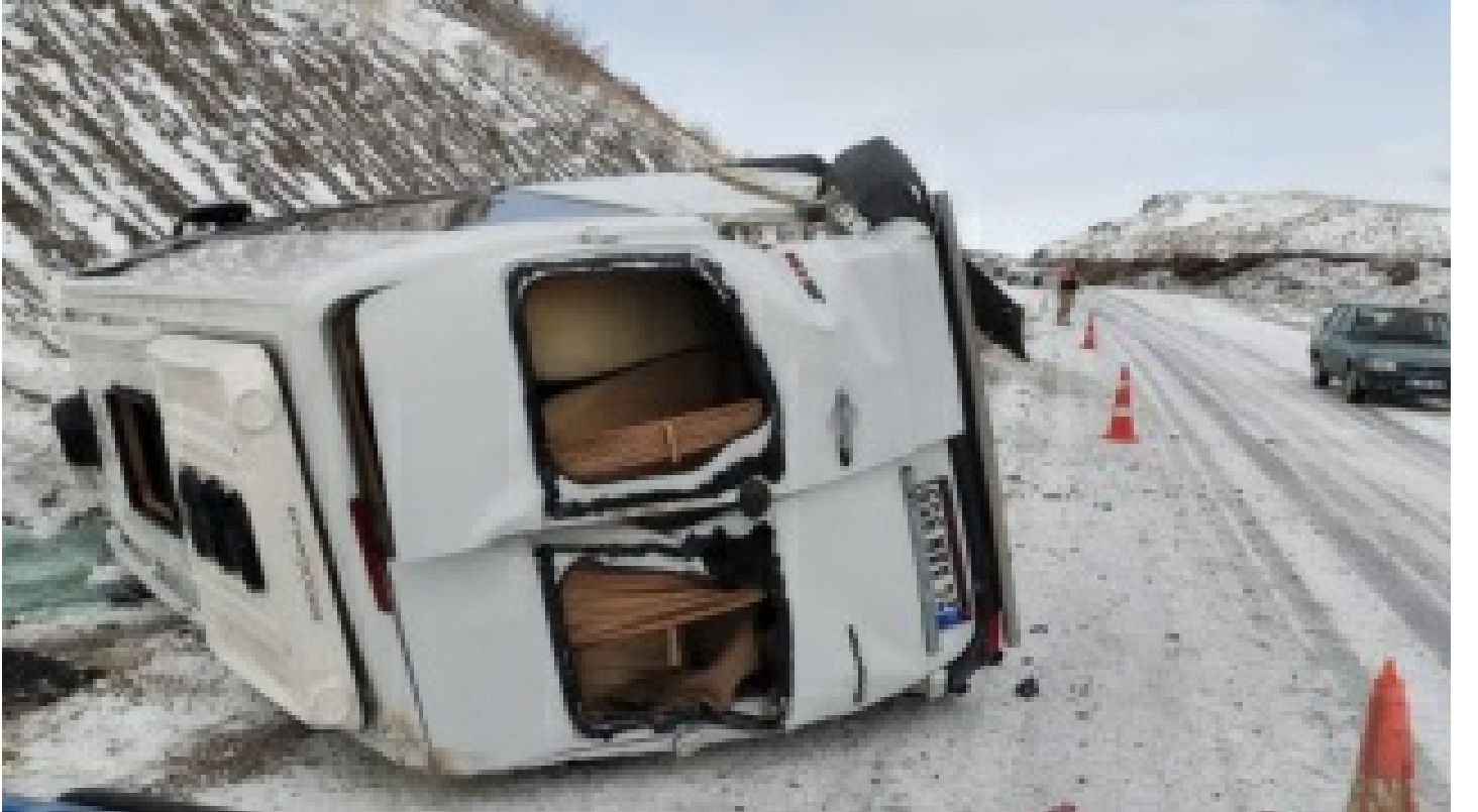
Erzincan'da devrilen minibüsteki 8 kişi yaralandı