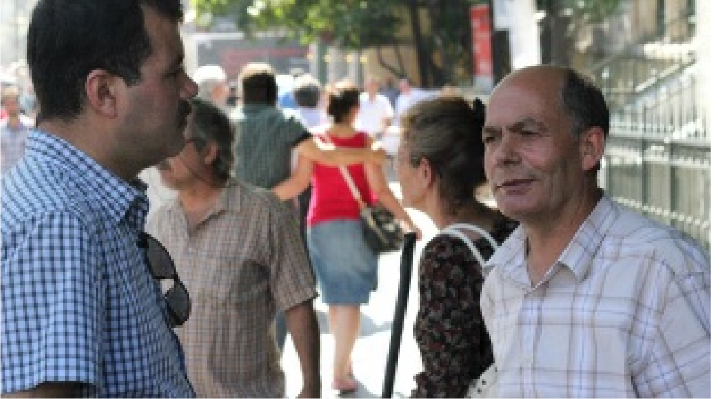
İliğine işlemiş cesaret erdemi... Onun için zor değil olağandı