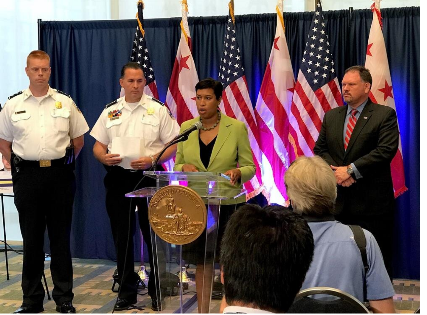
Washington Belediye Başkanı ve DC Polis Şefi

Newsham, ellerindeki tüm deliller kapsamında olaya karıştığı düşünülen 16 kişi hakkında yakalama kararı çıkarıldığını, bu kişilerden ikisinin dün tutuklandığını, 2 Kanada ve 12 Türk vatandaşının yakalanması için de çalışmaların devam ettiğini söyledi.