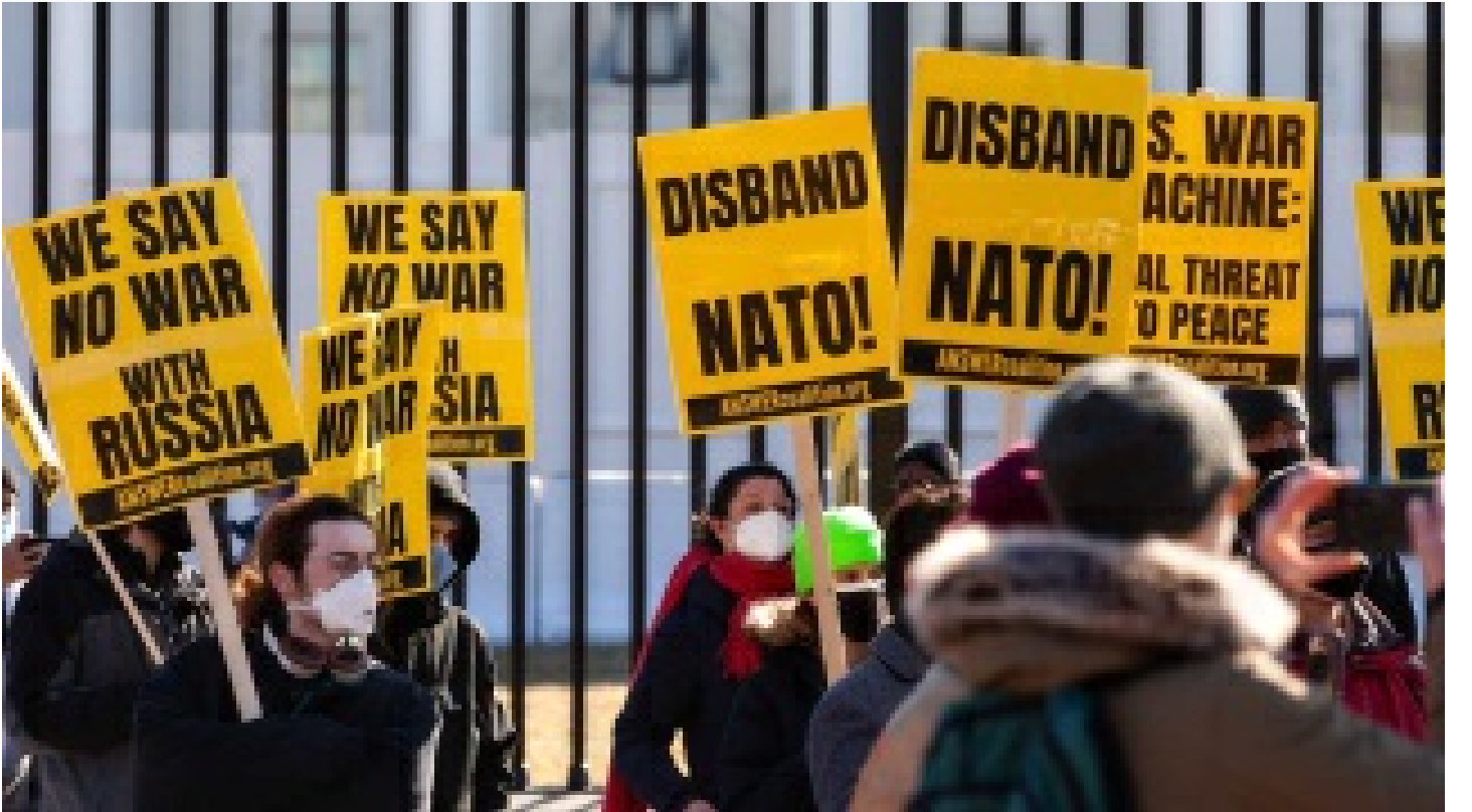
ABD'li sosyalistler: NATO lağvedilsin