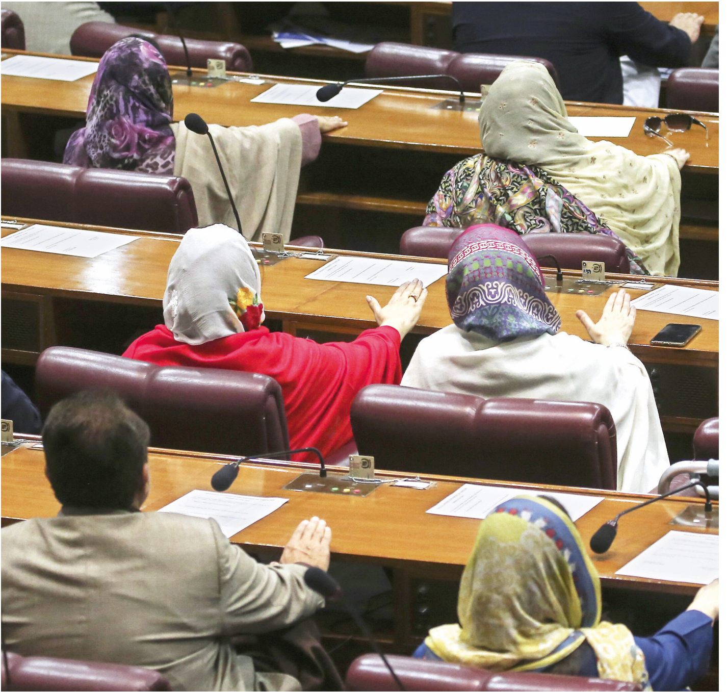
Pakistan Milli Meclisi

Cumhurbaşkanı Erdoğan ve Başbakan İmran Han'ın Parlamento Binası'na gelişini parlamento üyeleri masalarına vurarak karşıladı. İki ülke milli marşlarının dinlenilmesinin ardından, Kur'an tilaveti gerçekleştirildi. Konuşmasının ardından Pakistan Milli Meclisi Şeref Defteri'ni imzalayan Erdoğan'a, Pakistan Başbakanı İmran Han ile beraberindekiler eşlik etti. Erdoğan daha sonra Pakistanlı mevkidaşı Arif Alvi ile cuma namazını Pakistan Cumhurbaşkanlığı mescidinde kıldı.