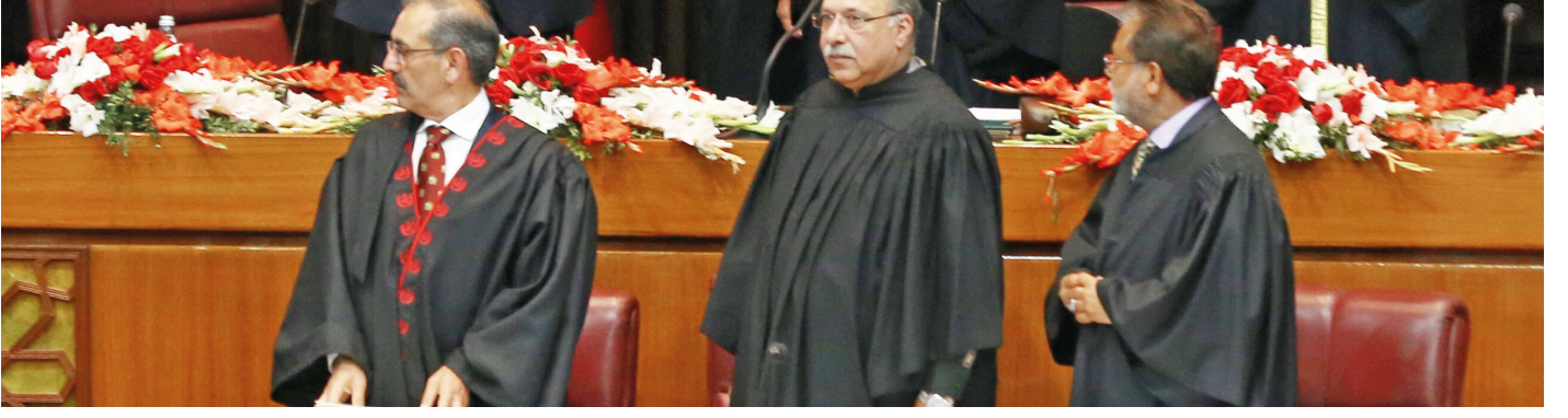
Asad Kayser (Erdoğan'ın sağında)

Ortak oturumda senatör ve milletvekillerine hitap etmek için meclise gelen Cumhurbaşkanı Erdoğan, meclisin iki kanadının başkan ve üyeleri tarafından karşılandı. Kur'an-ı Kerim tilaveti ve münacaat okunmasıyla başlayan oturumda konuşan Pakistan Ulusal Meclis (NA) Başkanı Asad Kayser, "Benim için size hitap etmek büyük onur. Burada sadece Pakistan'ın bir dostunu değil İslam dünyasının lideri ve önderini ağırlıyoruz" ifadesini kullandı. Kayser, Pakistan parlamentosu üyesi senatör ve milletvekillerinin Erdoğan'ın konuşmasını merakla beklediğine dikkati çekerek, "İslam dünyasının ikonik bir şahsiyeti olarak sizin aydınlatıcı görüşlerinizi dinlemek için sabırsızlanıyoruz" dedi. Kayser, sözlerini "Yaşasın Pakistan-Türkiye dostluğu" ifadeleriyle tamamladı.