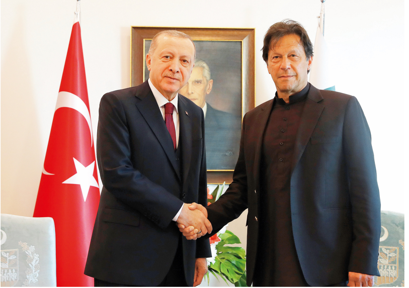
Cumhurbaşkanı Erdoğan ve İmran Han