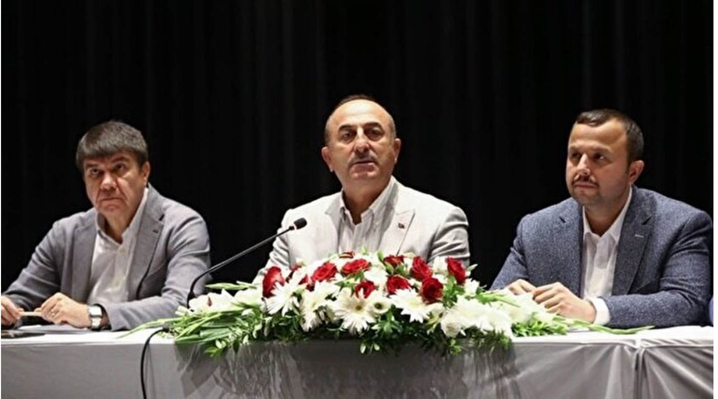
Dışişleri Bakanı Mevlüt Çavuşoğlu