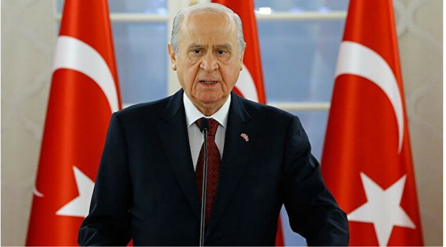
MHP Genel Başkanı Devlet Bahçeli