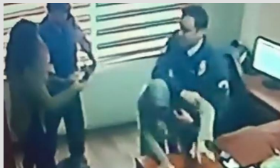
Yardım istedi, darbedilerek dışarıya atıldı