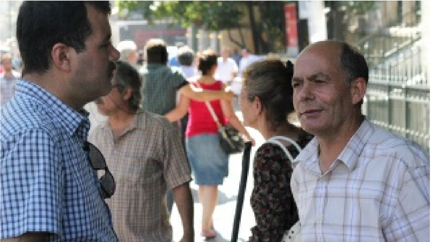
İliğine işlemiş cesaret erdemi... Onun için zor değil olağandı