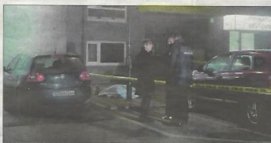
Užasna slika s mjesta tragedije: Dječak skočio s osmog sprata

- Majka sam, a moje dijete leži u hladnom grobu. Moj dječak, sat prije smrti, sjedio je na prozoru zgrade u kojoj je živio, a zatim je zapalio školski ruksak u džbenicama i zauvijek otišao sa ovoga svijeta. To je sve vidjela anonimna komšinica. Meni kao majci, ostaje pitanje kako da nam niko toga dana nije pokucao na vrata? Šta se može dogoditi djetetu, toliko strašno, toliko neizdrživo da to ne može podijeliti s rođenom majkom? Posljednjih sat vremena za me-