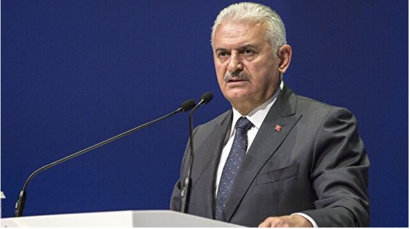
Başbakan Binali Yıldırım