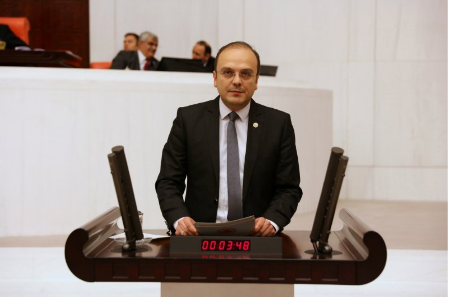
CHP Giresun Milletvekili Necati Tıǒlı