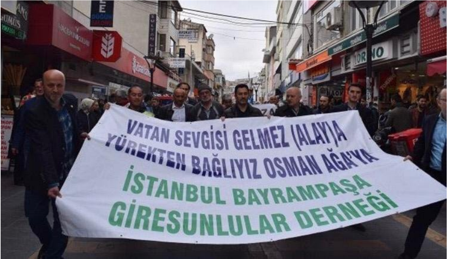
Bayrampaşa Giresunlular Derneği bu pankartı açarak yürüyüş de gerçekleştirdi.

“Topal Osman Ağa vatanın bölünmez bütünlüğü (BEKA için ne gerekiyorsa onu yapmıştır. TRT çalışanlarının içindeki Pontusçu Rumlar Türk milletinin değerlerine yaptığı bu ilk küstahlığı değildir. Şunu anlıyoruz ki, için Topal Osman Ağa'dan yarım kalan işimiz var. Topal Osman Ağa “Vatanın ha ekmeğini yemişim ha uğruna kurşunu” diyerek yola çıkmış milli kahramandır. Türkiye Cumhuriyeti'nin kurucusu Gazi Mustafa Kemal Atatürk'ün yaveri silah arkadaşıdır. Vatan için can alınır, can verilir. Osman Ağa devlet için can alıp can vermiş bir kahramandır. Ruhu şad, mekanı cennet, kabri nur bahçeleri dolsun.”