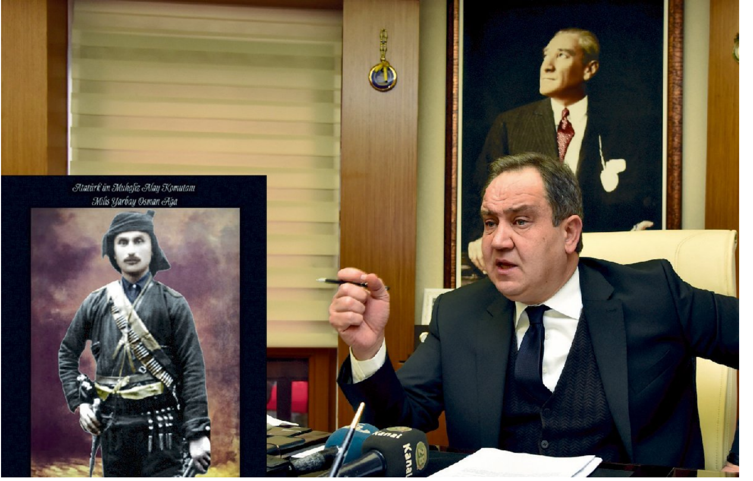
Giresun Belediye Başkanı Kerim Aksu