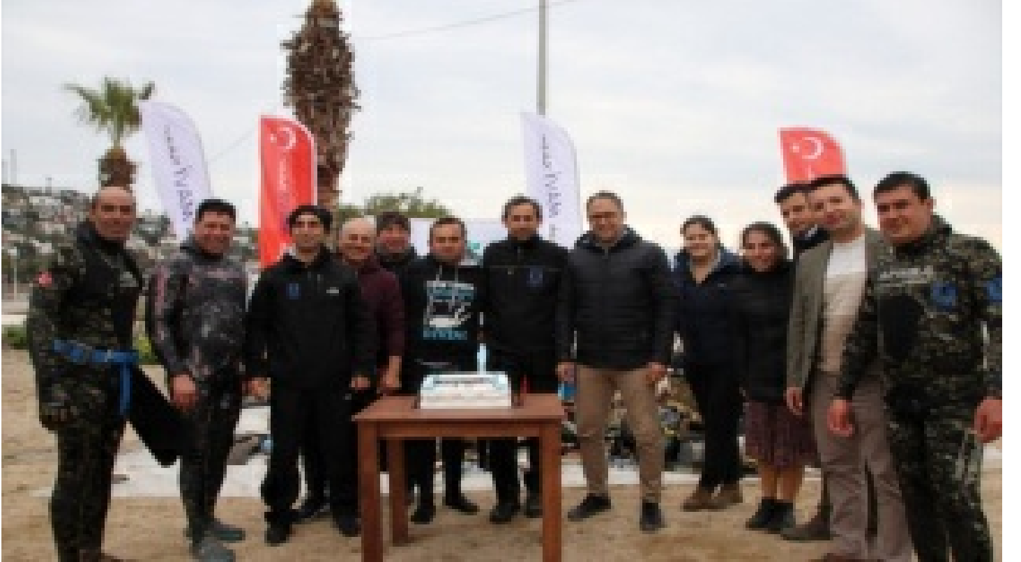
Dalęılar denizi, öęrenciler kıyıyı temizledi