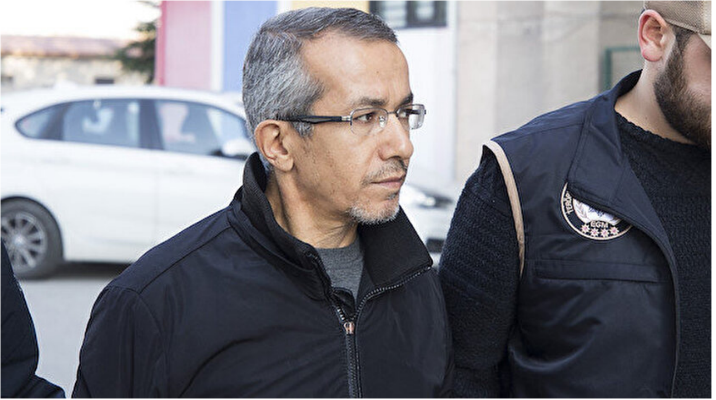
Eski savcı Ferhat Sarıkaya

Haber Merkezi · 02 Haziran 2019, 11:48 · Son Güncelleme: 02 Haziran 2019, 11:56 · AA