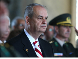
Başbuğ FETÖ'nün mesajını açıkladı!

15 Temmuz'da yaşanan olayda TSK'ya sızan FETÖ'nün cuntası var. Bunlar tek başına hareket etmiyor. Fethullah Gülen'den emir alıyor. 15 Temmuz'da yaşanan bu olayı FETÖ'nün silahlı darbesi olarak nitelendiriyorum. Bu cunta tek başına bu olayı planlayan, organize edilen bir hareket değildir. Yönlendirilen bir yapı var. Bu kalkışma FETÖ tarafından organize edilmesi açısından Türkiye tarihinde bir örneği bulunmayan bir kalkışma olarak görülmelidir.