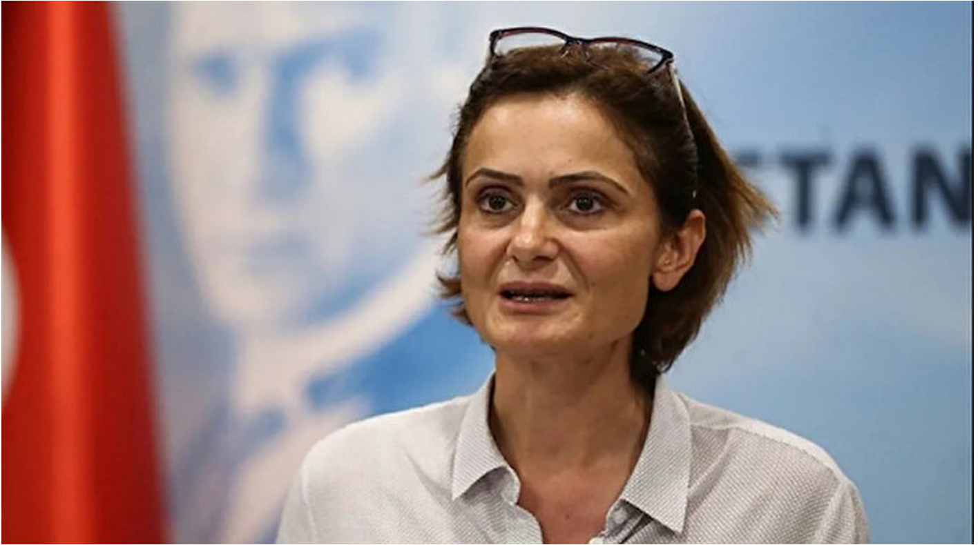
CHP İstanbul İl Başkanı Canan Kaftancıoğlu