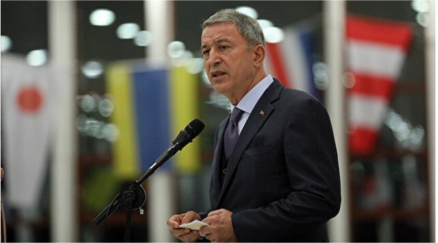
Milli Savunma Bakanı Hulusi Akar