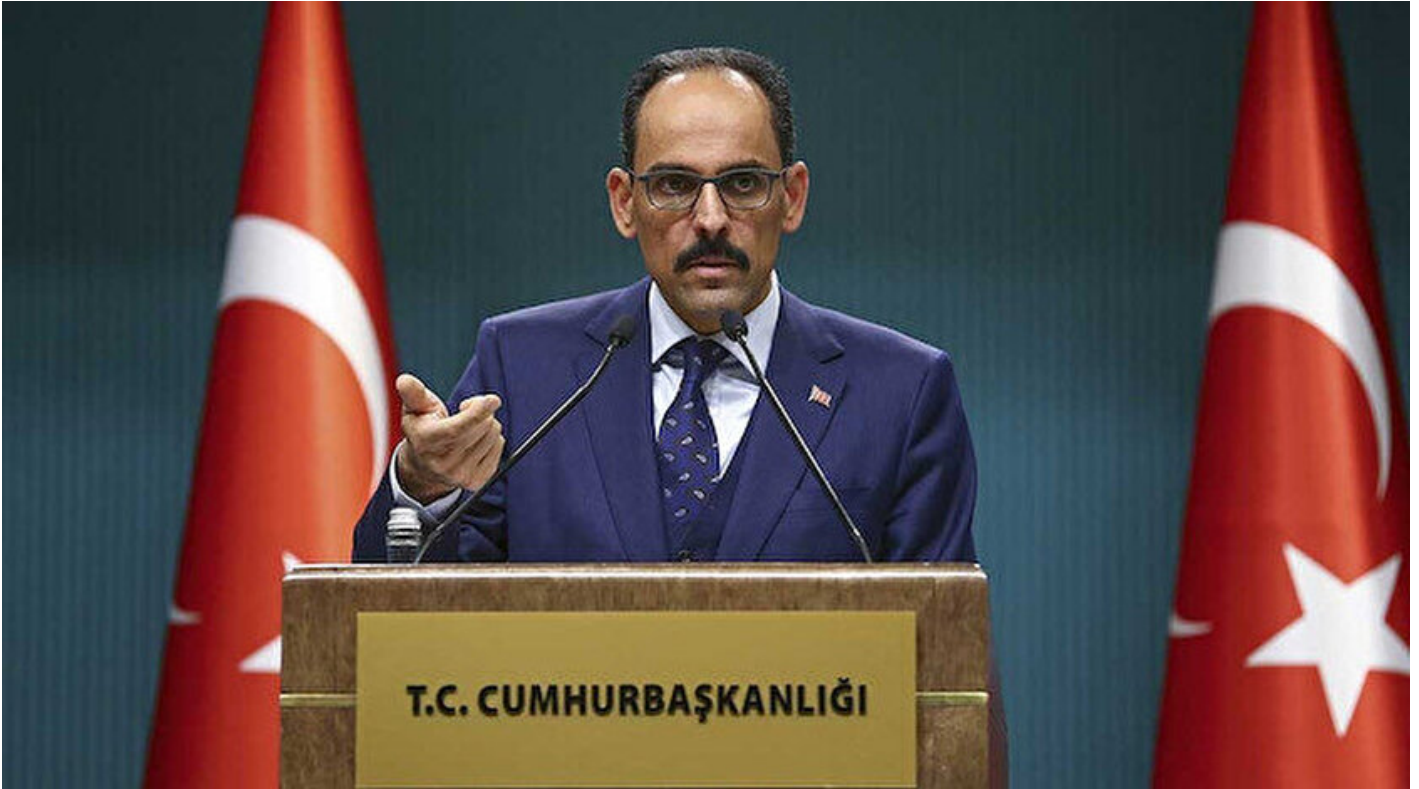
Cumhurbaşkanlığı Sözcüsü İbrahim Kalın

Haber Merkezi · 15 Temmuz 2020, 10:07 · Son Güncelleme: 15 Temmuz 2020, 10:16 · AA