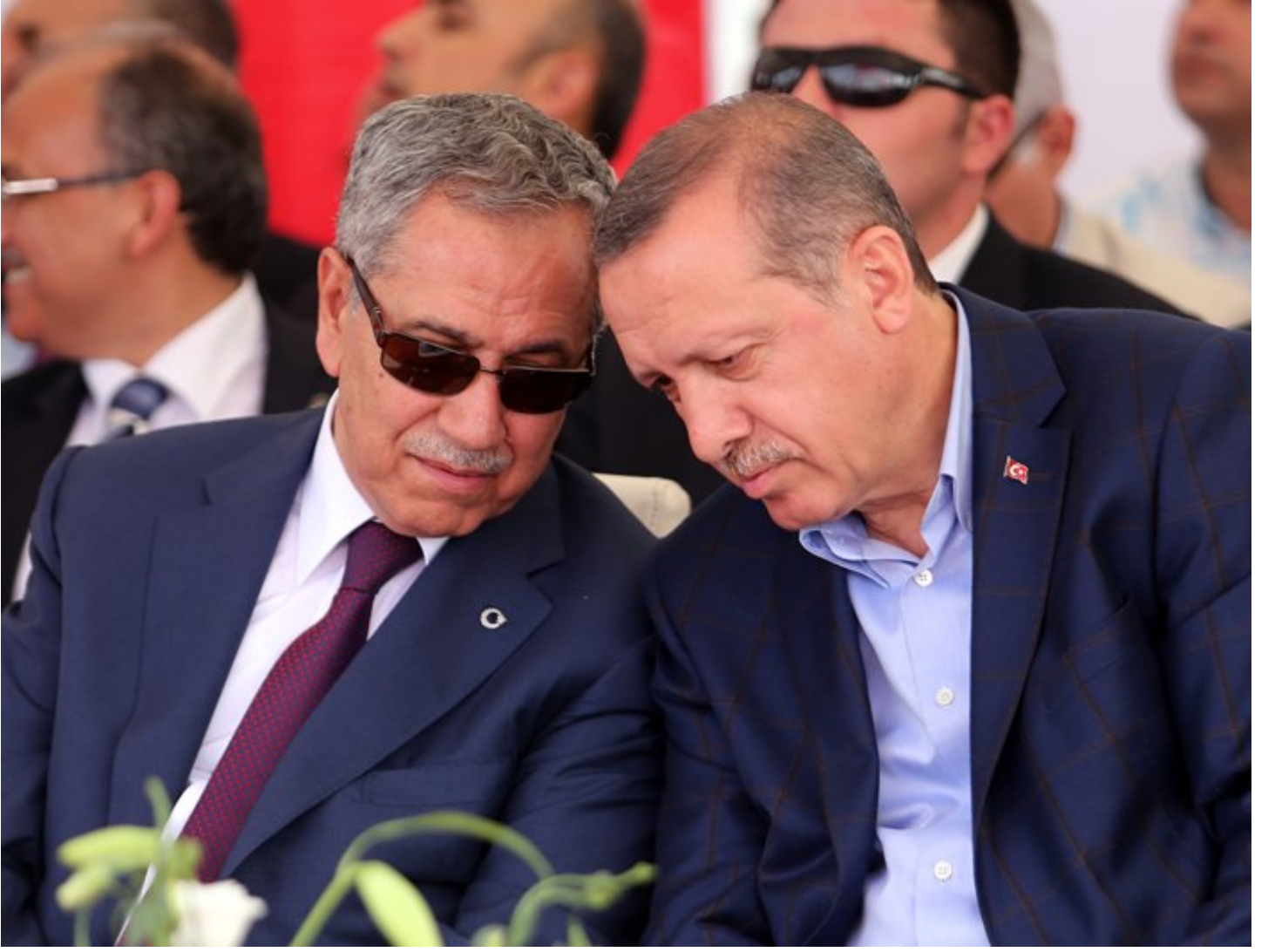
Cumhurbaşkanı Erdoğan ile Bülent Arınç, Refah Partisi yıllarından bu yana uzun yıllar birlikte siyaset yaptılar.

Fakat bir isim var ki neredeyse her dönemde Tayyip Erdoğan'ın yakın çevresinde oldu. Aralarındaki bazı fikir ayrılıkları kameralar önüne kadar yansısa da eski TBMM Başkanı ve Başbakan Yardımcısı Bülent Arınç her dönem siyasetin içinde aktif olarak rol aldı.