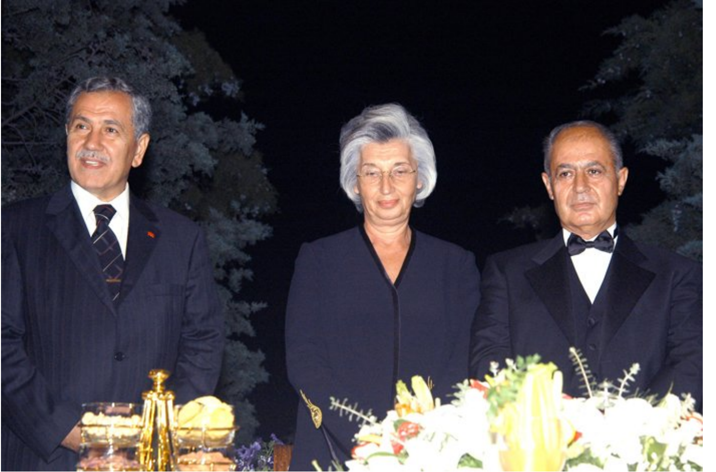
Bülent Arınç TBMM Başkanı sıfatı ile Cumhurbaşkanı Ahmet Necdet Sezer'in verdiği 30 Ağustos resepsiyonuna katılıyor. Arın. 2002-2007 yılları arasında TBMM Başkanlığı yapmıştı.

Başbakan Yardımcısı Bülent Arınç Türkiye'de internete getirilmesi planlanan yeni denetimler konusunda açıklamalarda bulunmuştu. Dönemin TÜSİAD Başkanı Ümit Boyner'in yeni internet yasasını eleştirmesi üzerine Arınç, “Sayın Boyner'in de çocukları var. Boyner ya da öyle düşünenler iktidara gelirse, porno sitelerini serbest bırakabilirler” diye konuşunca, Boyner de, bireysel özgürlükleri pornoyla bağdaştırmasının Arınç'ın ‘sağsız düşünce yapısını’ ortaya çıkardığını söylemişti. Boyner, “Beni ve çocuklarımı gündeme getirerek elde etmek istediği siyasi rantı ayıplıyorum” demişti.