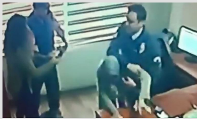
Yardım istedi, darbedilerek dışarıya atıldı