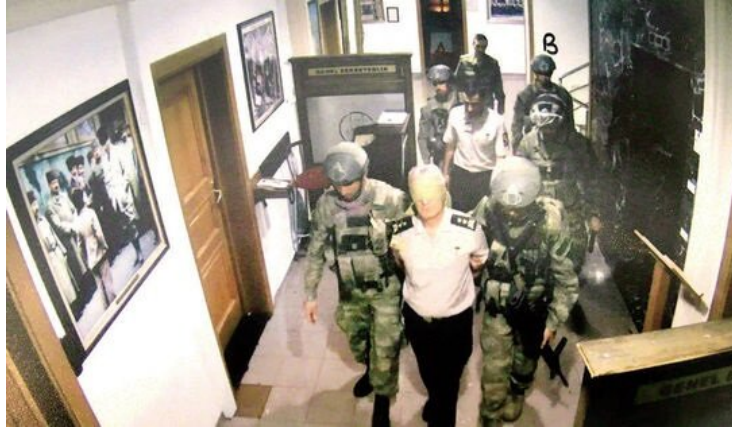
1- Eski Genelkurmay Harekat Plan Daire Başkanı Tümgeneral Baki Kavun:

YALAN: Darbecileri eylemlerinden vazgeçmeleri için ikna etmeye çalıştım. Darbeci Özel Kuvvetler personeli ellerimi ve gözleri bağlayarak beni derdest etti.