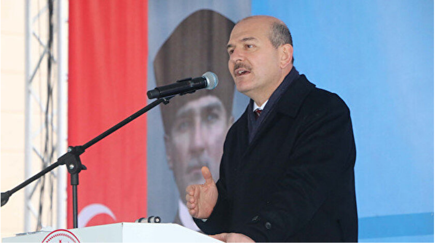
İçişleri Bakanı Süleyman Soylu