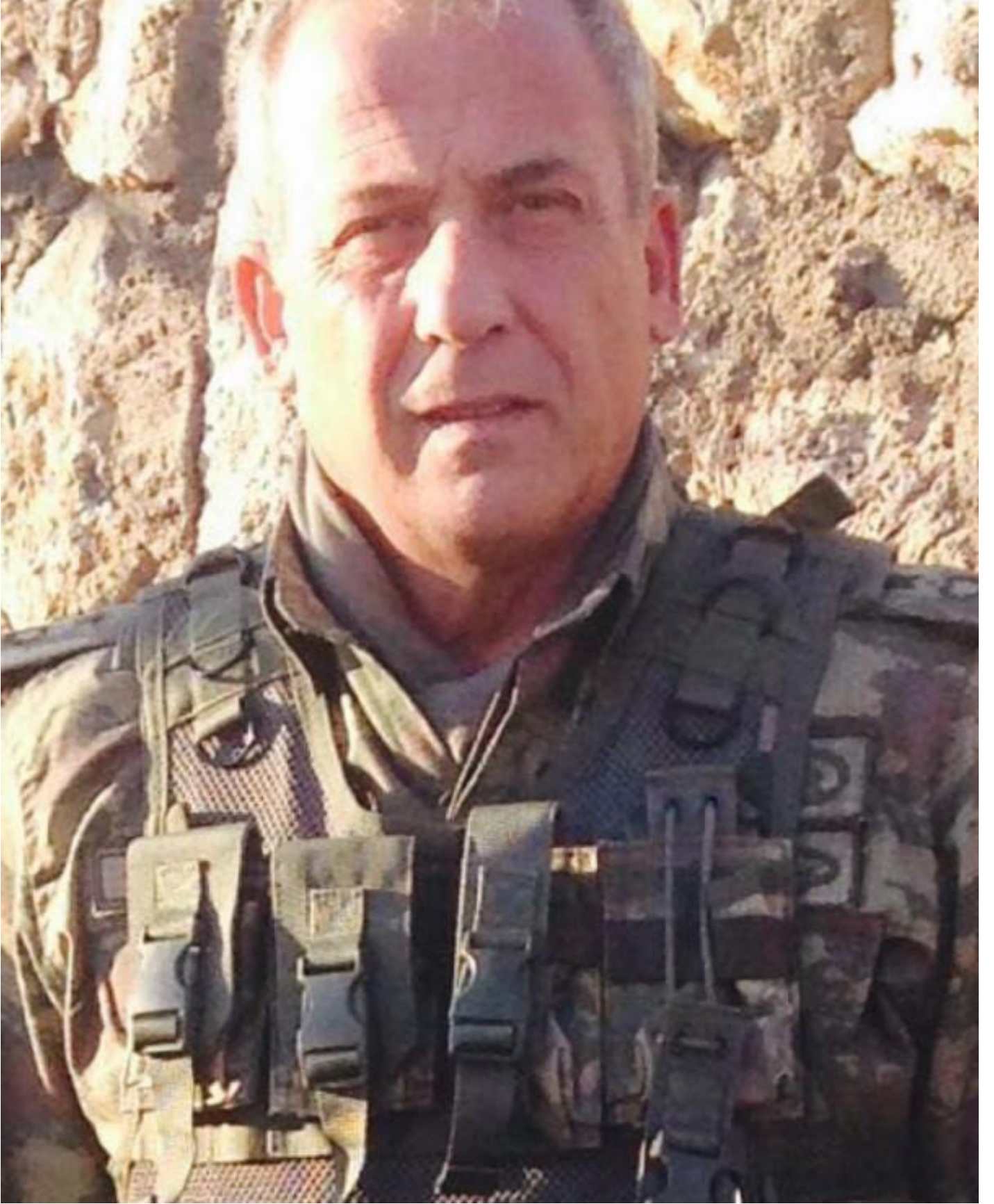
Tuğgeneral Semih Okyar