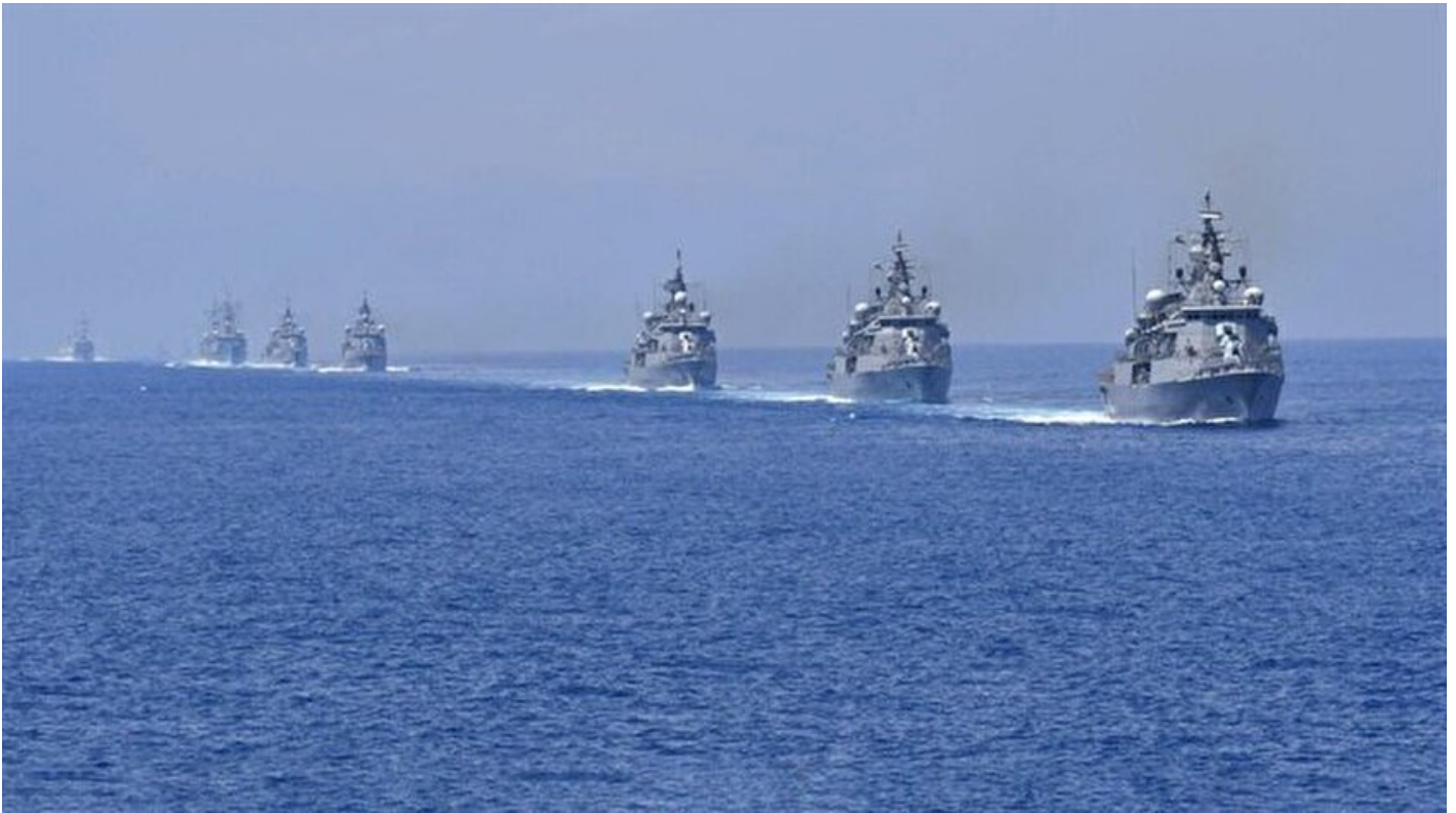
Ege Tatbikatı 2018