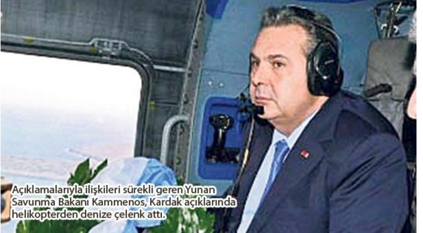
Yunanistan Savunma Bakanı Panos Kammenos

Erdoğan, 3. Cumhurbaşkanı Celal Bayar'ın 1952'deki Yunanistan ziyaretinden 65 yıl sonra Cumhurbaşkanı düzeyinde Yunanistan'a ilk resmi ziyarette bulundu. Bu ziyaretin gündem maddeleri arasında; ticaret hacminin 10 milyar dolara çıkarılması, İstanbul-Selanik hızlı treni ile İzmir-Selanik gemi seferleri projeleri yer aldı. İki ülke arasında Ege ile Doğu Akdeniz'deki ihtilaflar ile azınlıklarla ilgili sorunların geliştirilen ilişkilerin yaratacağı olumlu atmosfer içinde düşük gerilimde tutulmasına yönelik bir anlayış öne çıktı.