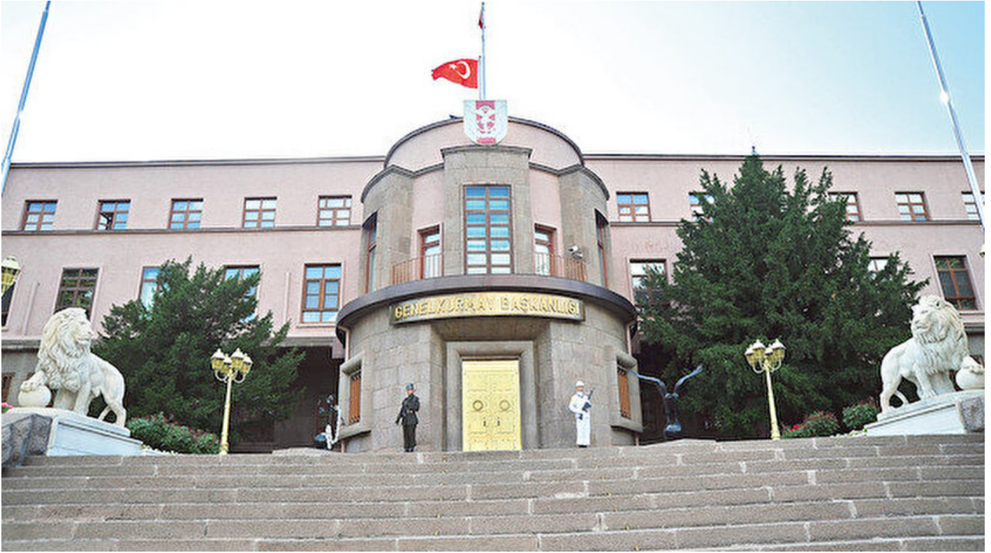
Genelkurmay Başkanlığı Binası