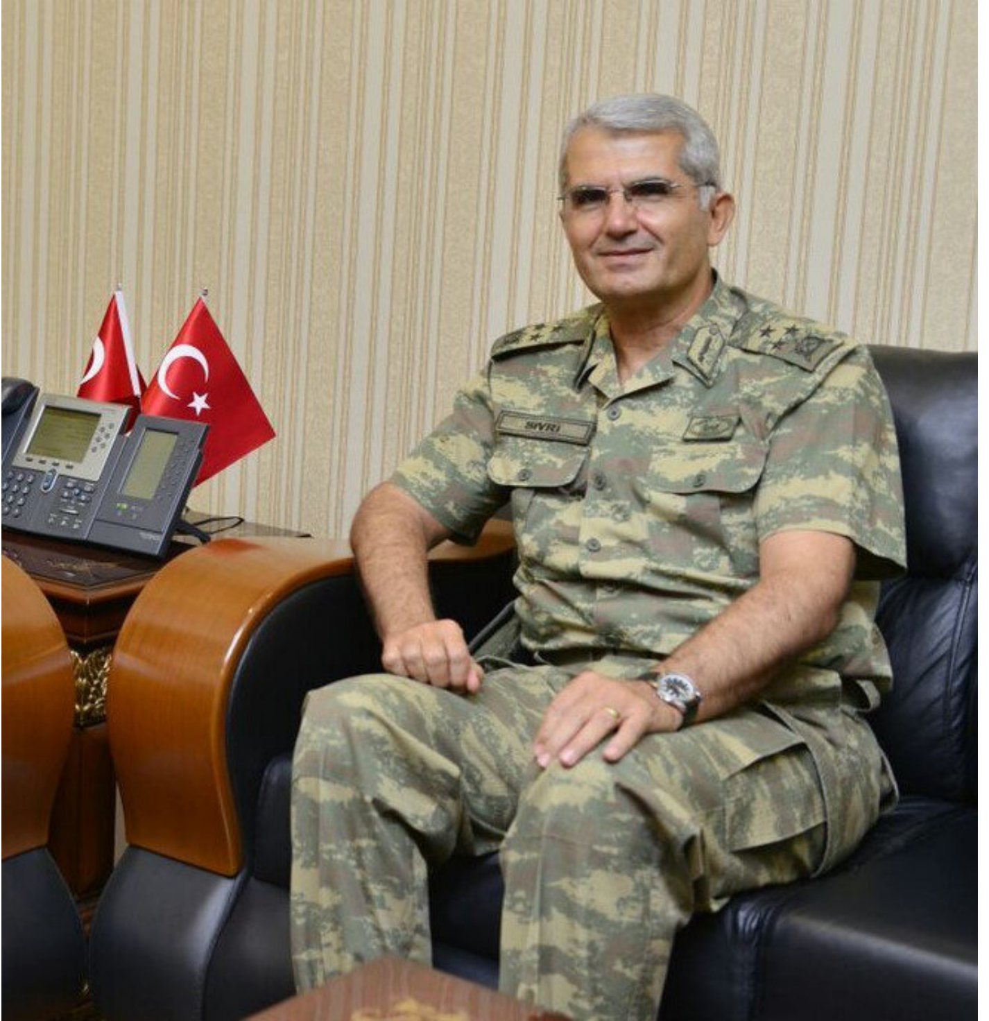
Kolordu Komutanı Korg. Ali Sivri ise Ege Ordu Komutanı oldu.