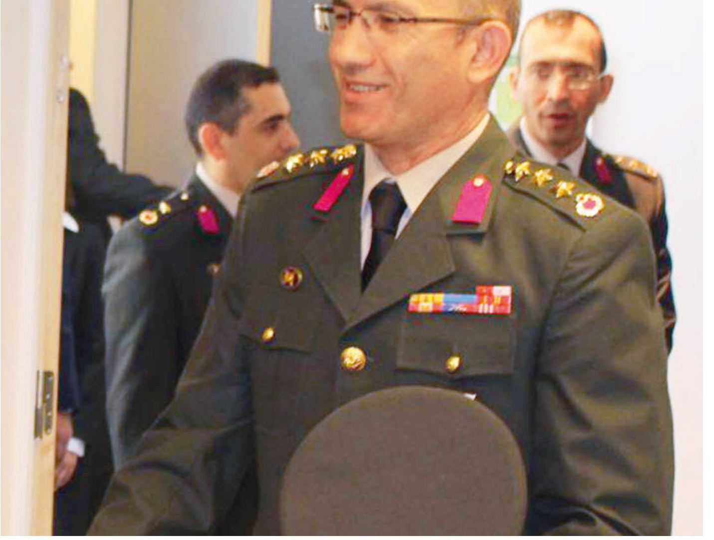
Tümg. Sezai Öztürk

Kıbrıs Türk Barış Gücü, Güvenlik Kuvvetleri ve adadaki mekanize ve zırhlı piyadelerin komutanları da değışti. Kıbrıs Türk Barış Kuvvetleri Komutanlığına Tümg. Sezai Öztürk, Güvenlik Kuvvetleri Komutanlığına Tuğg. Altan Er, Kıbrıs 28. Mekanize Piyade Tümen Komutanlığına Tuğg. Taner Uysal, Kıbrıs 39. Mekanize Piyade Tümen Komutanlığına Tuğg. Nihat Ergün, KKTC 14. Zırhlı Tugay Komutanlığına ise KKTC Güvenlik Kuvvetleri Kurmay Başkanı Tuğg. Osman Akyıldız getirildi. Deniz Kuvvetleri'nde ise Akdeniz Bölge Komutanlığı'na SAT'çı amiral atandı. Doğu Akdeniz'in emanet edildiği İskenderun Üs Komutanı Tuğa. Ercan Kireçtepe, Kardak çıkarmasını yapan askerler arasındaydı.