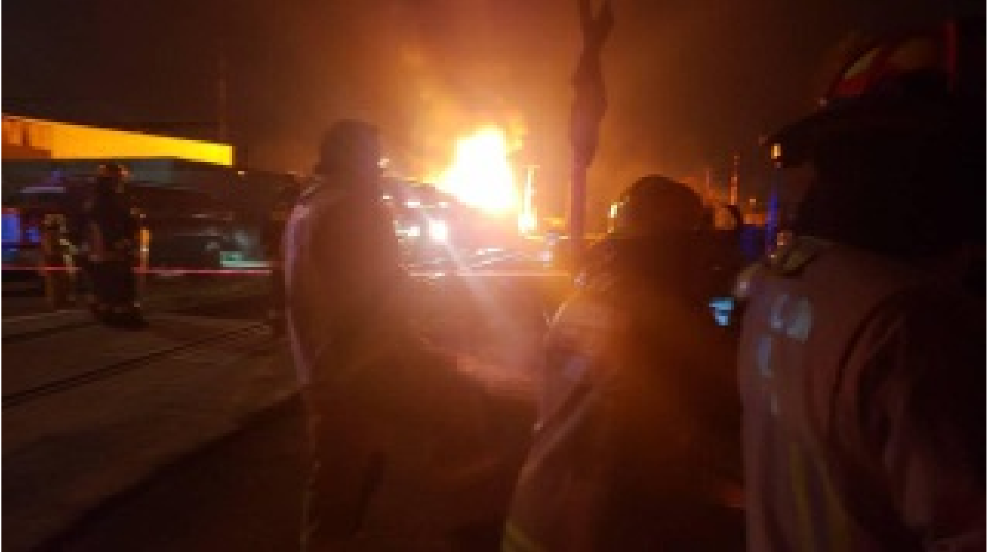
Dolmabahe Sarayı'nda yangın!