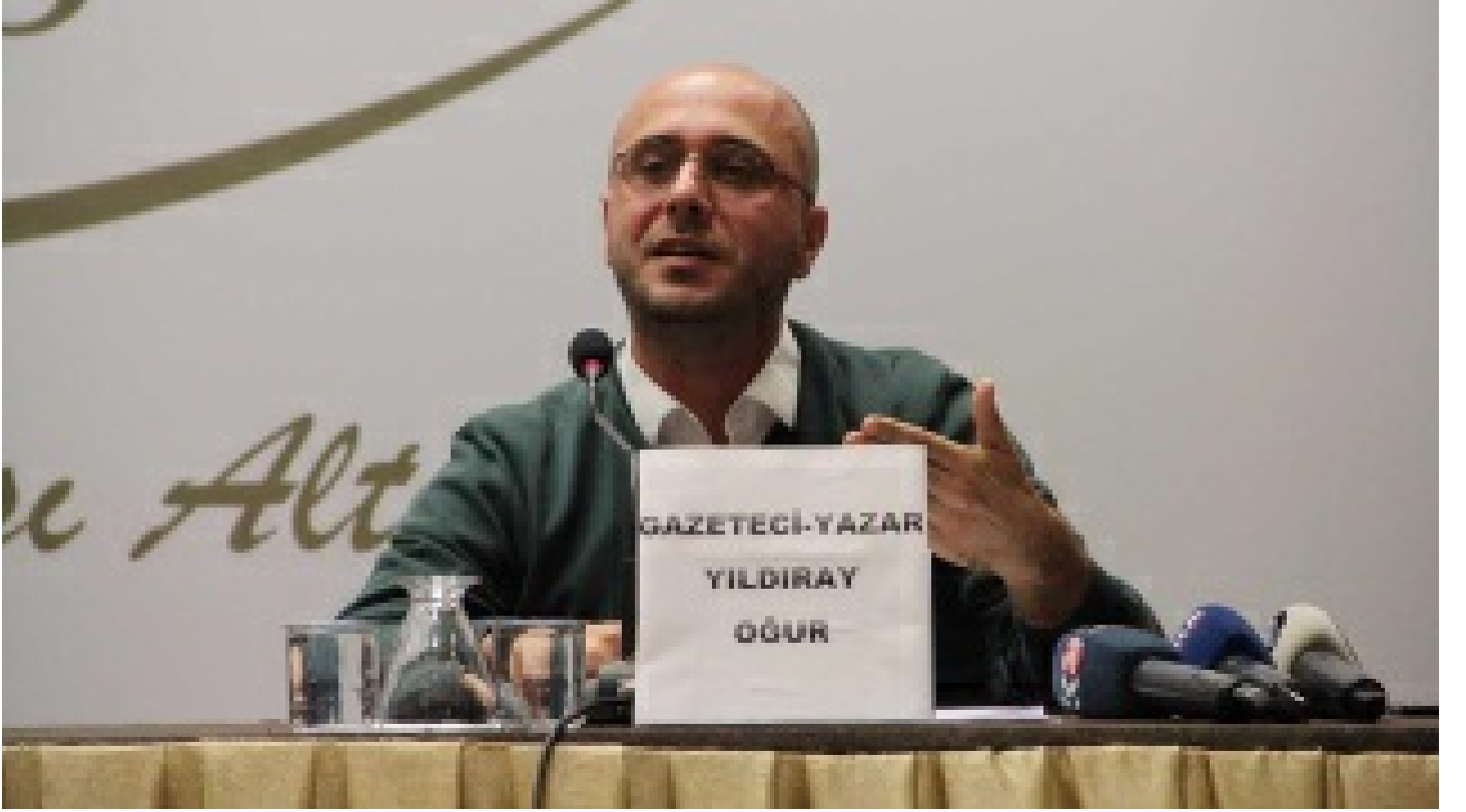
Yıldıray Oğur'un kalemi